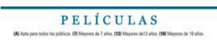
(A) Apto para todos los públicos. (7) Mayores de 7 años. (13) Mayores de13 años. (18) Mayores de 18 años.