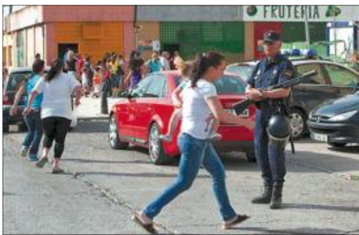
Un momento de la operación policial en el Polígono Sur de Sevilla.

La junta general de accionistas de Hijos de Ybarra SA acordó ayer la creación de Grupo Ybarra Alimentación, participado al 50% por Migasa e Hijos de Ybarra, ratificando así el acuerdo de integración adoptado por sus respectivos consejos de administración por el que Migasa adquirirá el 50% de los activos de Ybarra, que incluirá las marcas, la maquinaria y las instalaciones. Según destacó Ybarra en una nota, con esta alianza se crea uno de los mayores grupos agroalimentarios del mercado español con una importante actividad exportadora. Asimismo, resaltó que este nuevo grupo permitirá conseguir "importantes sinergias, ahorros de costes y, en definitiva, incrementar la actividad que hasta ahora desarrollaban ambos grupos".