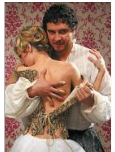
Una escena de La fierrecilla domada .