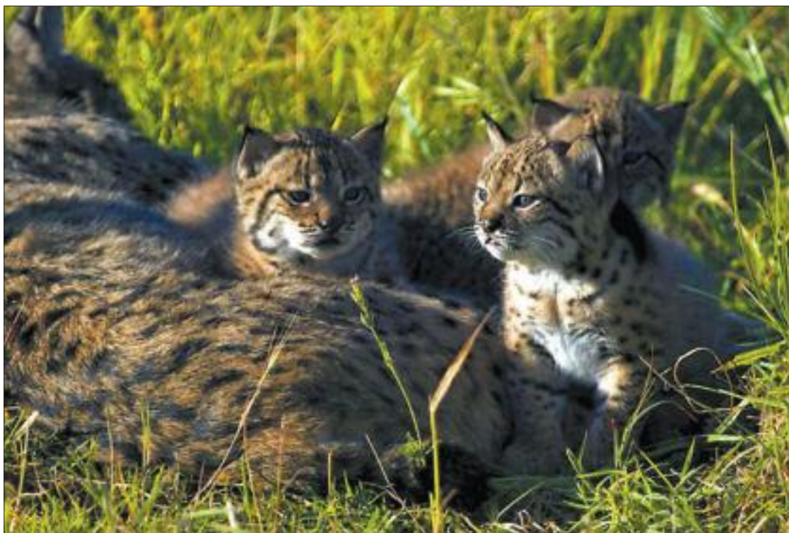
Tres de los cachorros nacidos esta primavera en El Acebuche (Huelva).

El PSOE parece tenerlo todo bien atado, pero pone una serie de condiciones que son las que hoy tendrán que negociar. Algunas pueden ser duras de asumir por los demás grupos, sobre todo la relativa a que los demás reconozcan la "legitimidad de las urnas" (el PSOE fue la lista más votada en 2007) y "apoyen la investidura" de un alcalde socialista y la "libertad de éste para conformar su equipo de gobierno".