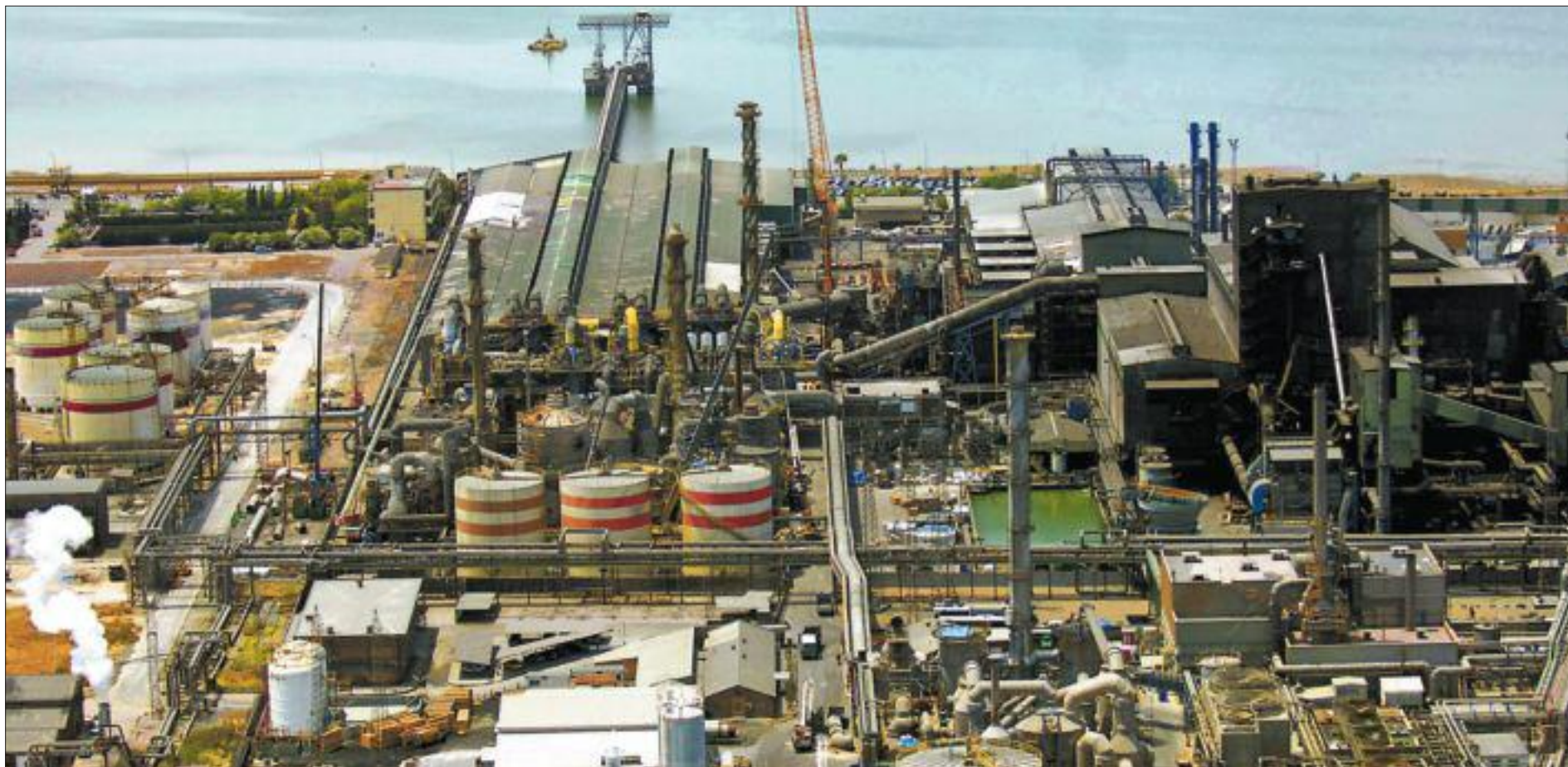
Vista aérea de una de las instalaciones industriales del Polo Químico de Huelva.